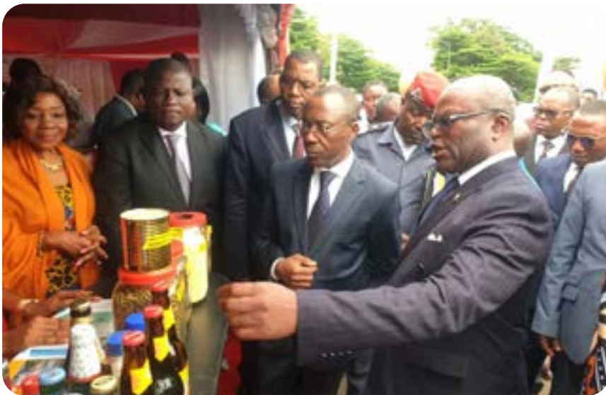
Le Directeur Régional Senior présente le savoir-faire de Boissons du Cameroun au MINMIDT

Boissons du Cameroun showcases its expertise