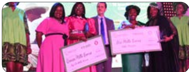
Team Côte d'Ivoire