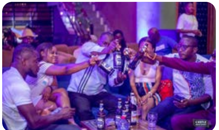
A la santé des connaisseurs