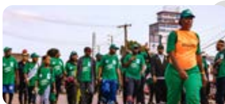
L'UNITE EN MOUVEMENT AVEC VITALE P18