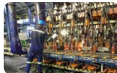
CONDUCTEUR IS P26 INSTRUMENTISTE P27 SUPPORT MAINTENANCE SEMC P27