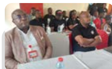
RENCONTRES DISTRIBUTEURS – CLIENTS P36