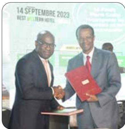
Signature de la convention entre le FPC et la CCIMA