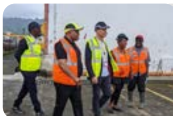
PRESENCE TERRAIN P14