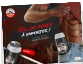
DOPPEL 50CL P7