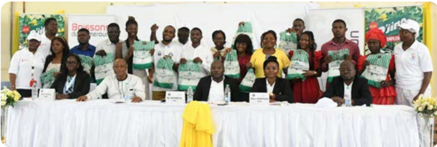
Conférence à l'Université de Douala

Boissons du Cameroun connecté au reste du monde