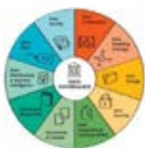
DATA OFFICE P31