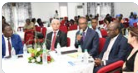
CÉRÉMONIE DE REMISE DU PRIX PIERRE CASTEL AUX LAURÉATS DE LA 6ÈME ÉDITION INVESTISSEMENTS P22 P24