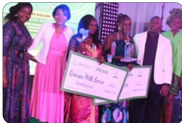
Team Burkina Faso