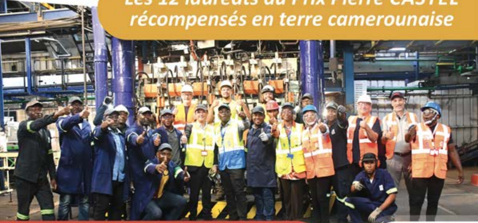
Une nouvelle ligne pour booster la production du verre à SOCAVER