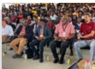
FORMATION P33 CASTEL CARE P33 EXCELLENCE SCOLAIRE 2023 P34