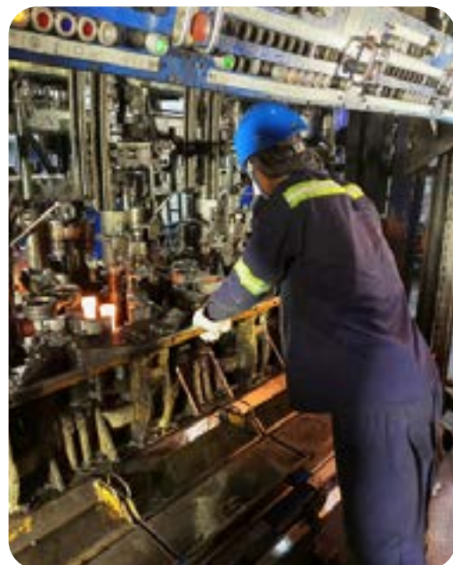
Graissage des moules