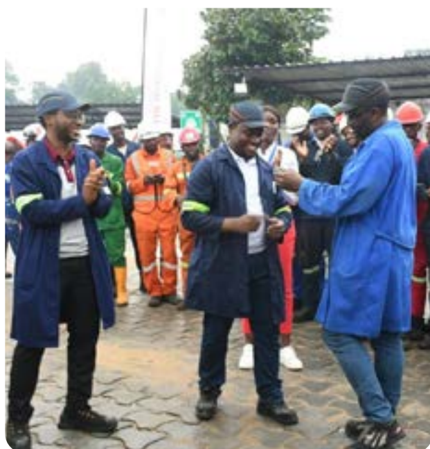
Bienvenue à la première bouteille

La Société Camerounaise de Verrerie, unique verrerie d'Afrique centrale, s'inscrit à plus de 90% dans l'économie circulaire, l'un des objectifs de la transition énergétique et écologique et l'un des engagements pour le développement durable. La nouvelle Ligne de production est entrée en fonction le 5 juillet 2023.