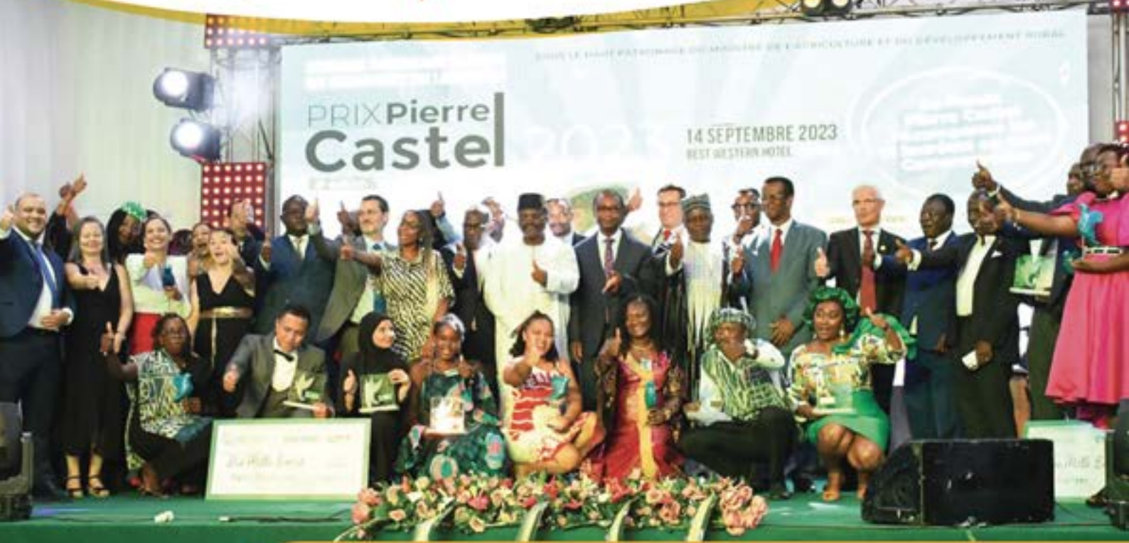
Les 12 lauréats du Prix Pierre CASTEL récompensés en terre camerounaise