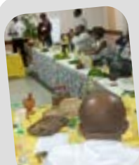
POINT A MI PARCOURS P29