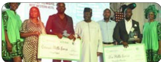
Team République Démocratique du Congo