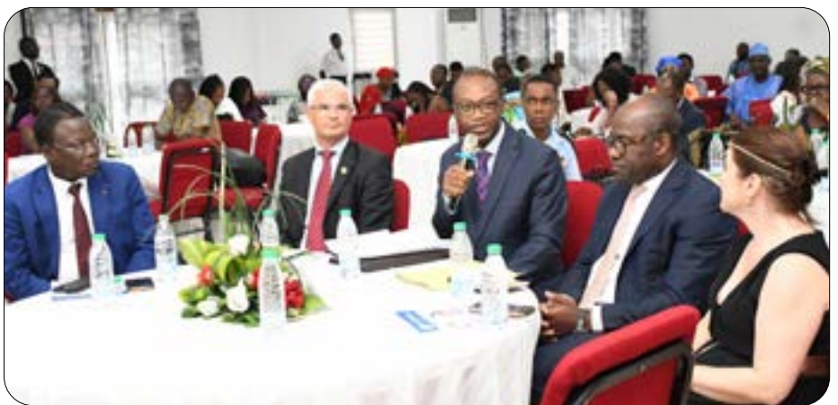
Intervention du MINPMEESA à la table ronde

Ainsi, les premiers lauréats ont reçu chacun une dotation financière de 15 000 €, soit environ 10 millions de FCFA, ceci, en plus d'un parrainage, d'un coaching et d'une formation d'un an. Les seconds ont quant à eux eu droit à 10 000€ (6,5 millions de FCFA) chacun. Ils bénéficieront aussi d'un coaching ainsi que d'une formation d'un an.