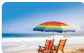
LES CONGES ANNUELS P. 41